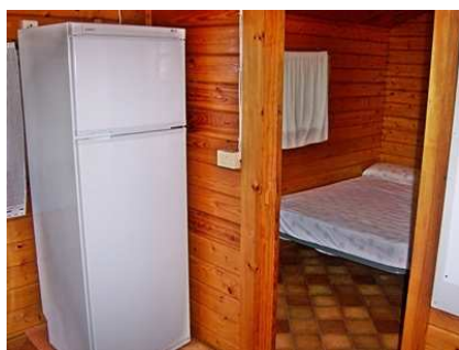
Teilansicht der Küche