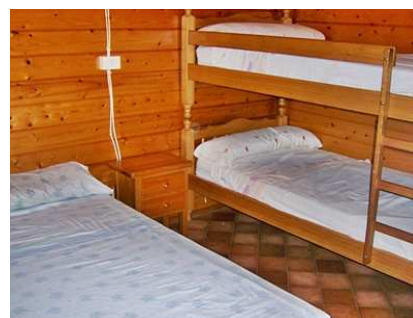
Teilansicht des Schlafzimmers