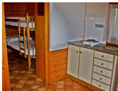
Teilansicht der Küche