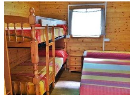
Teilansicht des Schlafzimmers