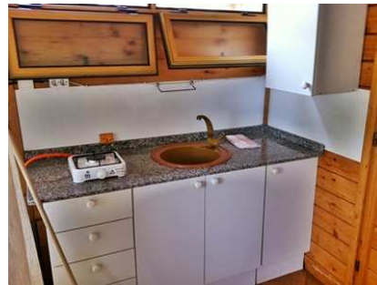
Teilansicht der Küche