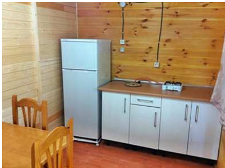
Teilansicht der Küche