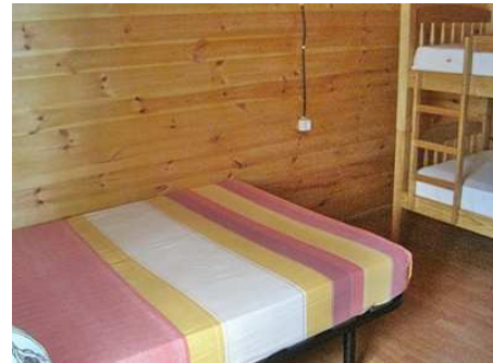
Teilansicht des Schlafzimmers