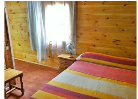
Teilansicht des Schlafzimmers