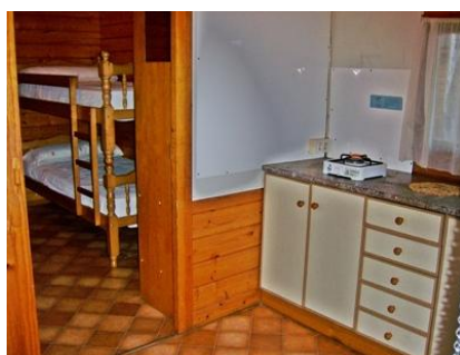
Vista parcial cocina