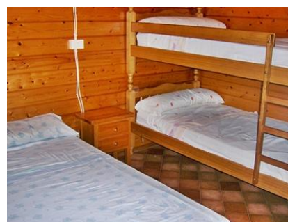
Vista parcial habitación