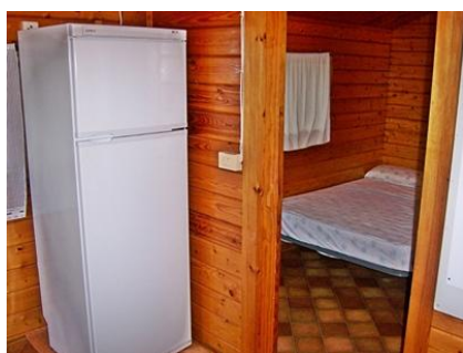
Vista parcial cocina

Hora de entrada: 12:00 h. Hora de salida: 10:00 h.