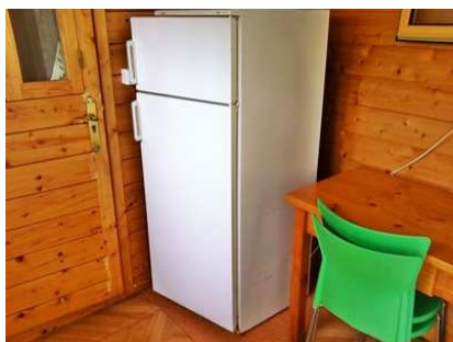
Vista parcial cocina

Hora de entrada: 12:00 h. Hora de salida: 10:00 h.