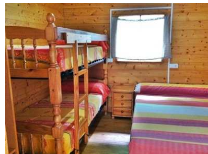
Vista parcial habitación