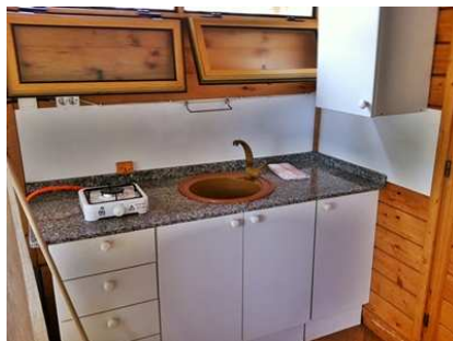
Vista parcial cocina